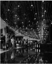
2013.5 Vol.58 No.5 表紙写真／伊勢丹新宿店 (P.48)

STAFF 編集長／山倉礼士 編集／車田 創 塩田健一 高橋剛大 高柳 圭 玉木裕希 DTPデザイン／武田康裕 (DESIGN CAMP) 広告／三木亨寿 田村裕樹 岡野充宏 川上史威 販売／工藤仁樹 愛読者係／関根裕子 経理／村上琴里 支社／小杉匡弘(広告) アート・ディレクション／ SOUP DESIGN レイアウトデザイン／ SOUP DESIGN+ 武田康裕 印刷／凸版印刷株式会社