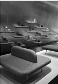
2015. 7 Vol.60 No.7 表紙写真／ミュウミュウ 青山店 (P.50)

STAFF 編集長／山倉礼士 編集／車田 創 塩田健一 高橋剛大 玉木裕希 神山真美子 竹島兄人 DTPデザイン／宇澤佑佳 広告／三木亨寿 田村裕樹 岡野充宏 武村知秋 販売／工藤仁樹 愛読者係／関根裕子 経理／村上琴里 支社／小杉匡弘(広告) アート・ディレクション／ SOUP DESIGN レイアウトデザイン／ SOUP DESIGN + 宇澤佑佳 印刷／図書印刷株式会社