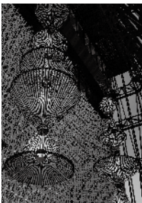
2016. 6 Vol.61 No.6 表紙写真／東急プラザ銀座 (P.44)

STAFF 編集長／山倉礼士 副編集長／塩田健一 編集／車田 創 玉木裕希 神山真美子 竹島兄人 伊藤梨香 DTPデザイン／宇澤佑佳(SOY) 広告／三木亨寿 田村裕樹 岡野充宏 小杉匡弘 販売／工藤仁樹 山脇大輔 愛読者係／関根裕子 経理／村上琴里 支社／武村知秋(広告) アート・ディレクション／ SOUP DESIGN レイアウトデザイン／ SOUP DESIGN + 宇澤佑佳 印刷／図書印刷株式会社