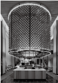
2025.2 Vol.70 No.2 表紙写真／ノボテル奈良(P.78)

STAFF 編集長／塩田健一 副編集長／車田 創 編集／平田 悠 村上桂英 DTPデザイン／宇澤佑佳(SOY) 広告／小杉匡弘 岡野充宏 雨宮 諒 三木亨寿 販売／工藤仁樹 関根裕子 経理／村上琴里 支社／武村知秋(広告) アート・ディレクション／BOOTLEG レイアウトデザイン／BOOTLEG＋宇澤佑佳 印刷／TOPPANクロレ株式会社